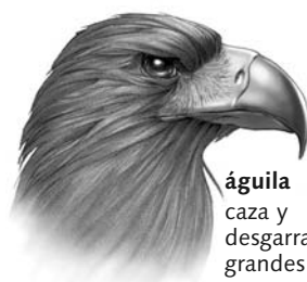
águila caza y desgarrar grandes presas