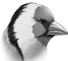
jilguero come semillas