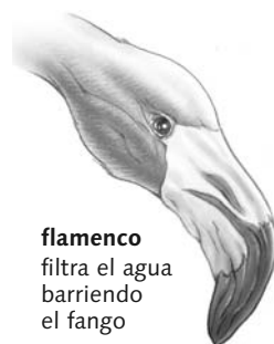
flamenco filtra el agua barriendo el fango