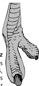
avestruz fuertes y robustas, adaptadas para correr