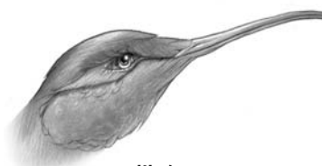
colibrí succiona néctar de las flores