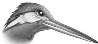
martín pescador pesca buceando