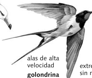
alas de alta velocidad golondrina