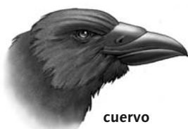
cuervo come carroña