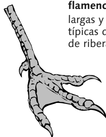
flamenco largas y finas, típicas de aves de ribera