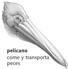
pelicano come y transporta peces