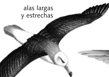
alas largas y estrechas albatros