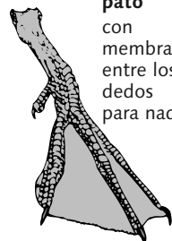
pato con membranas entre los dedos para nadar