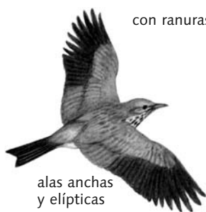
alas anchas y elípticas papamoscas