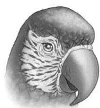
loro abre frutos secos